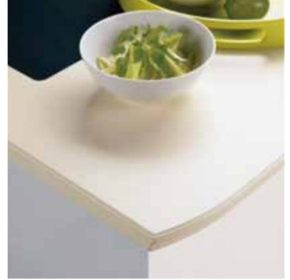
塗装エッジカウンター