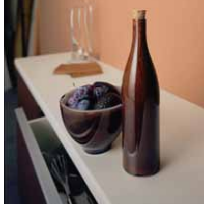
ポストフォームカウンター